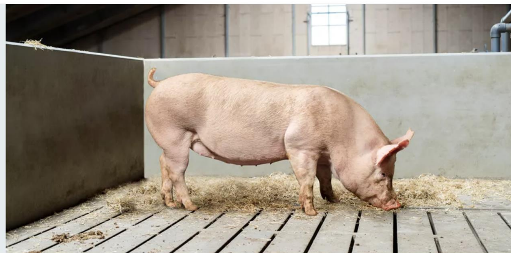
MODERLINJE AVLSMÅL, LANDRACE/YORKSHIRE

Danish Genetics' avlsprogram for moderlinjerne, Landrace og Yorkshire er designet med soproducenterne for øje for at producere den mest optimale F1-so. Målet er at producere super-søer, der er karakteriseret ved at producere mere kød per årsso, føde stærke og robuste pattegrise og er nemme at håndtere. Derfor har moderlinjerne et specifikt fokus på reproduktion (ornefertilitet og levedygtige pattegrise), robusthed (holdbarhed og styrke) samt moderegenskaber (pattegriseoverlevelse og tidlig vækst). Derudover, bidrager moderlinjerne med halvdelen af genetikken til det kommercielle hybrid-slagtesvin. Derfor vægtes også egenskaber for vækst, effektivitet og slagte kvalitet højt i avlsprogrammet for moderlinjerne.