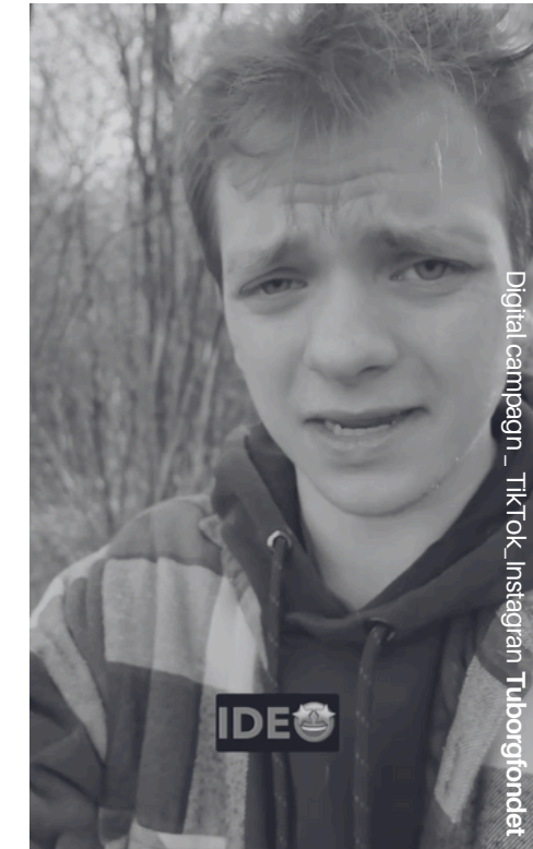
Projektleder på Tuborgfondets influencer-kampagne på TikTok & Instagram - Lancering, datanalyse og monitorering