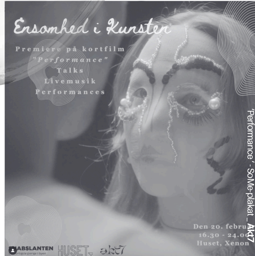
Projektleder og producer på det tværkunstneriske event Ensamhed i Kunsten